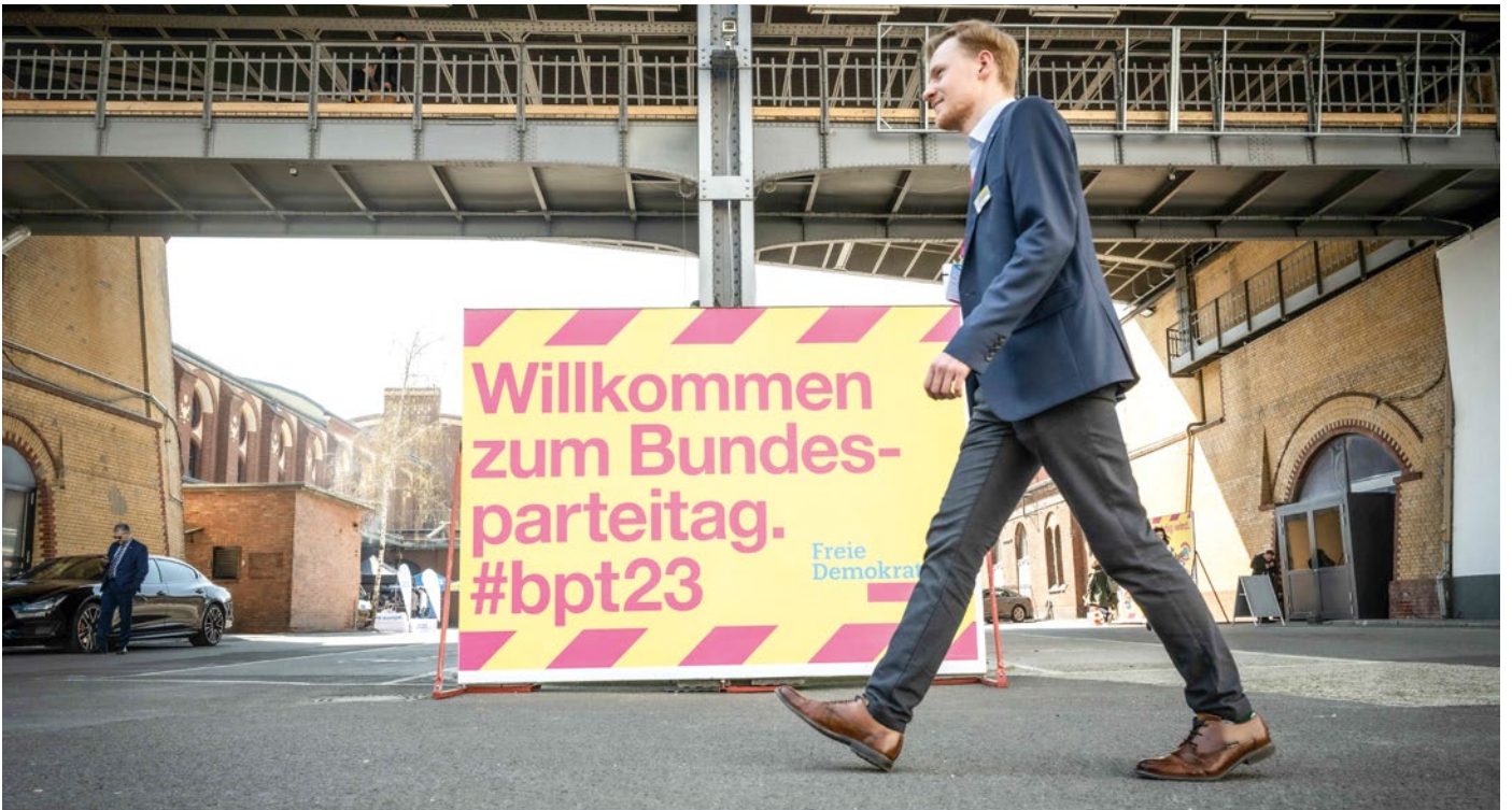
74. Bundesparteitag der FDP in Berlin