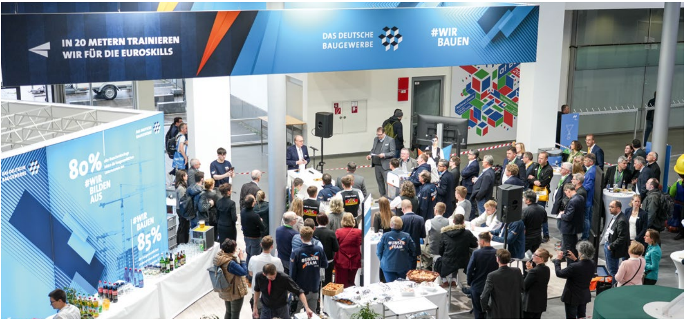
Seit Jahren eine feste Institution für viele Messegäste. Der Baugewerbetreff des ZDB am Mittwochabend