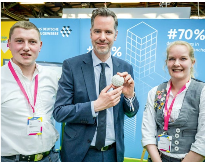
Christian Dürr, Fraktionschef der Freien Demokraten