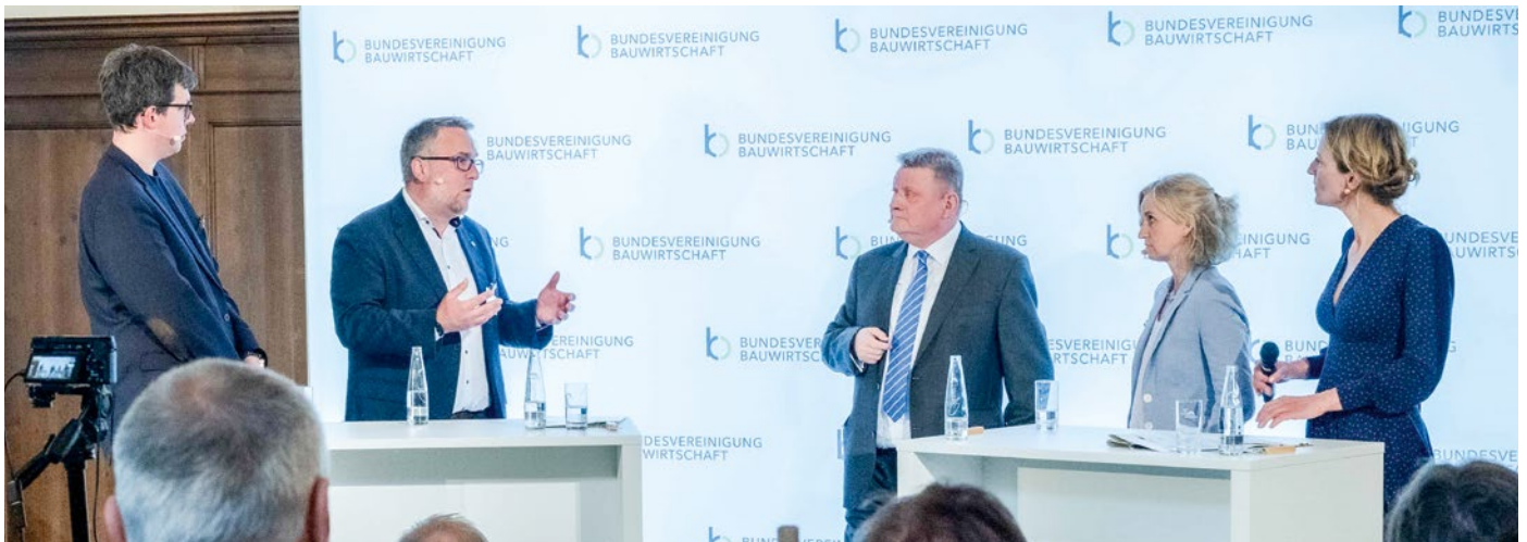
Politik und Bauwirtschaft in spannender Diskussionsrunde