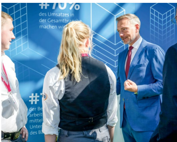
Christian Lindner, Bundesminister der Finanzen und Vorsitzender der FDP