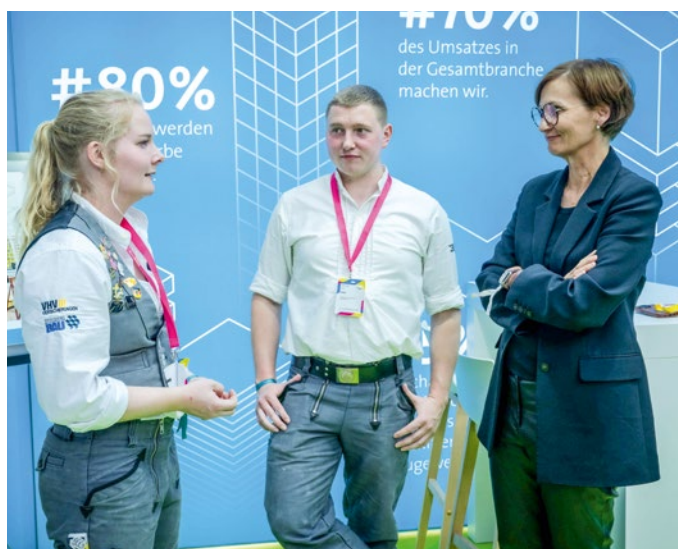
Bettina Stark-Watzinger, Bundesministerin für Bildung und Forschung