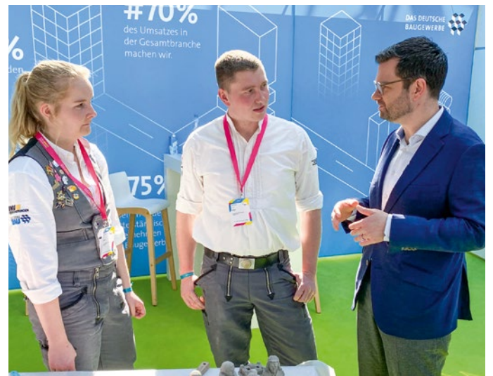
Marco Buschmann, Bundesminister der Justiz