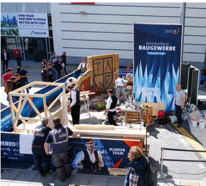
Trainingscamp Nationalteam Baugewerbe