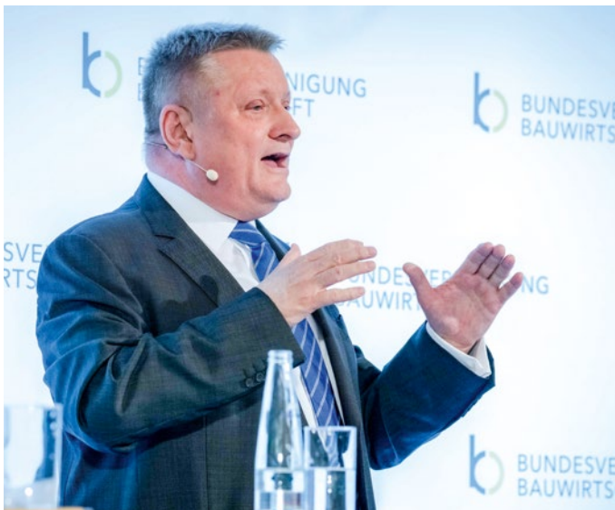
Hermann Gröhe MdB