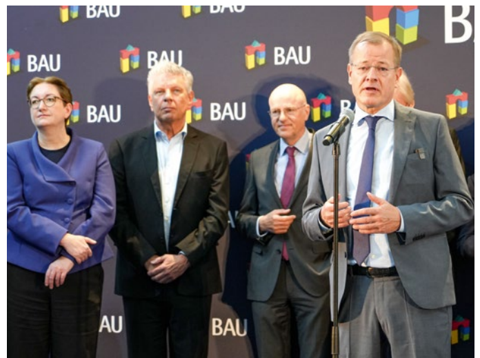
Bild oben und Mitte: ZDB-HGF Felix Pakleppa, Bundesbauministerin Klara Geywitz und weitere Gäste eröffnen die BAU 2023

Eine neue Kooperation des Baugewerbes wurde auf der Messe offiziell: Das Traditionsunternehmen Sievert SE unterstützt mit der Produktmarke quick-mix als Hauptsponsor fortan die Maurer des Nationalteams Deutsches Baugewerbe. Durch die Zusammenarbeit profitieren die besten Nachwuchsmaurer des Landes vom Know-how eines internationalen Players im Bereich Mörtel- und Betonsysteme.